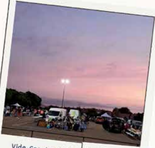
Vide Grenier A.P.E.L 7 septembre