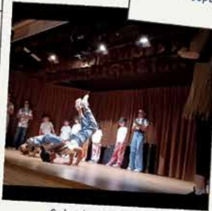
Gala de Dynamik Flow 10 mai