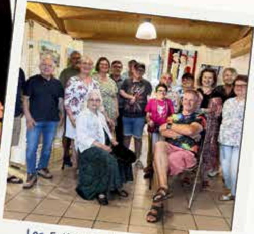
Les Estivales de la Cour du 16 juillet au 26 août