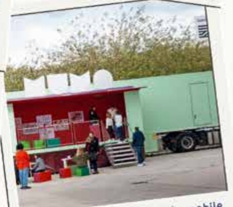
Portes ouvertes du Musée mobile du Centre Pampidou 21 mars