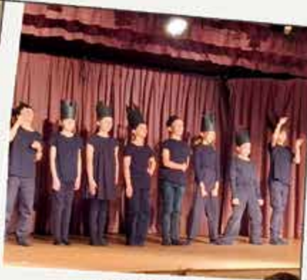
Représentation Fou de Bassan enfants 24 & 25 mai