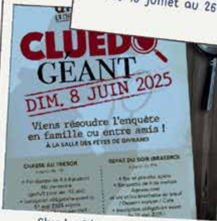
Cluedo Géant des "Givrés" 8 juin