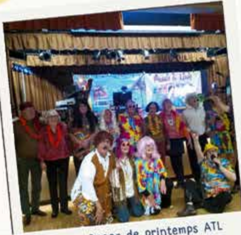
Repas de printemps ATL 6 mars