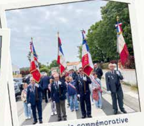
Cérémonie commémorative du 8 mai