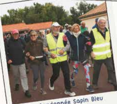
Randonnée Sapin Bleu 27 septembre