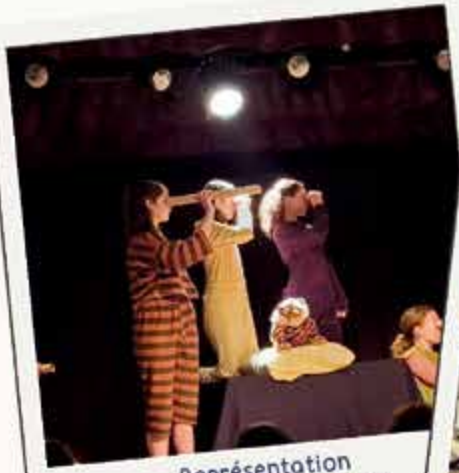
Représentation Fou de Bassan Ados 24 & 25 mai