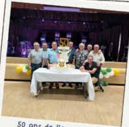
50 ans de l'association des chasseurs 26 avril