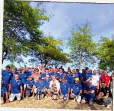
Concours de pétanque interne 16 août