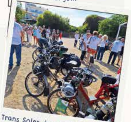
Trans Solex des Vieilles Soupapes du 8 au 12 septembre