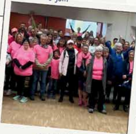
La Joséphine 4 octobre