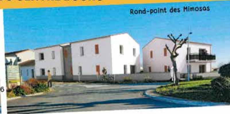
Rond-point des Mimosas