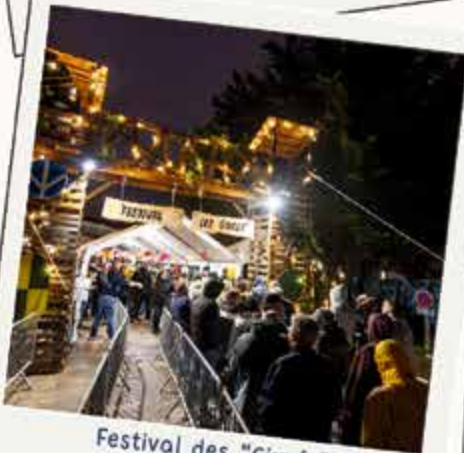
Festival des "Givrés" 20 septembre