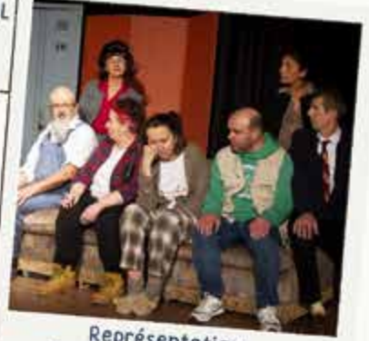
Représentation Fou de Bassan adultes 28-29-30 mars & 4-5 avril