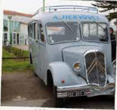
Vide grenier Vieilles Soupapes 16 mars