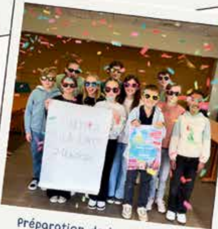
Préparation de la Run Color par le CMJ 1 er mars