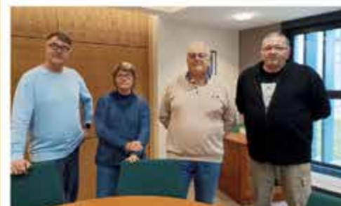
Bénévoles transport solidaire