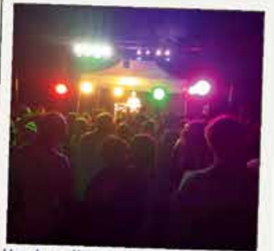
Un duo d'exception : Run Color et Fête de la musique 21 juin