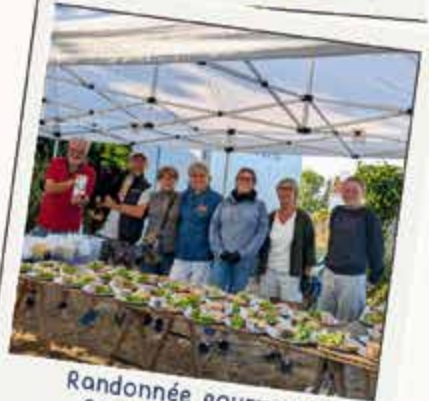
Randonnée gourmande Comité de Jumelage 2 août