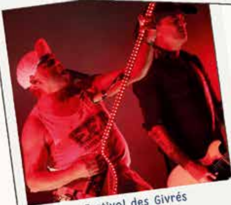
Festival des Givrés 20 septembre