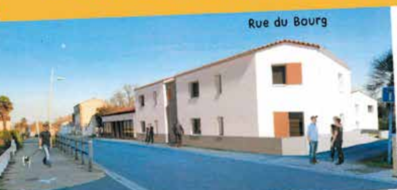
Rue du Bourg