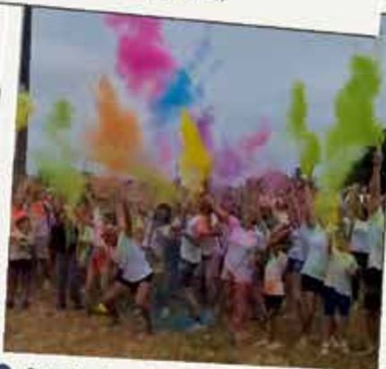
Run Color à l'initiative du CMJ 21 juin 27